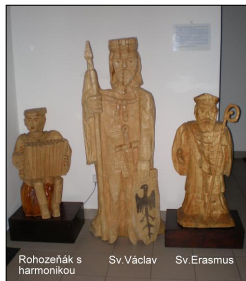
Rohožeňák s harmonikou